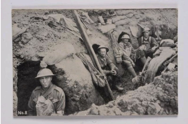
Soldats Britanniques dans une tranchée

Le musée est ouvert tous les jours de 10h à 18h (y compris les jours fériés). Fermeture annuelle de la mi-décembre à la mi-janvier.