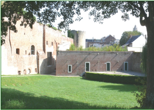
Aire de Pique-nique au Théâtre de verdure

Autres visites possibles pour compléter votre journée :