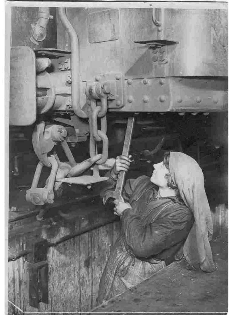
Historial de la Grande Guerre

Dis Maman, que faisaient les femmes pendant que les hommes combattaient ?